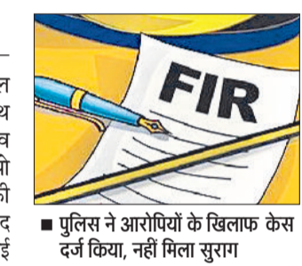
पुलिस ने आरोपियों के खिलाफ केस दर्ज किया, नहीं मिला सुराग

वाहनों में टक्कर हो गई और हल्की क्षतिग्रस्त हुई। वह बचकर अपनी कार सहित कंपनी परिसर में अंदर चले गए, लेकिन गाड़ी भी पीछा करते हुए परिसर में घुस आई। गाड़ी से उतरे दो युवकों ने उनके साथ हाथापाई की। हाथापाई के दौरान युवकों ने पीड़ित की कार की चाबी, आवश्यक दस्तावेज तथा कार में रखी 80 हजार रुपये की नकदी छीन ली। चाबी छीनने के बाद एक युवक उनकी कार में बैठ गया, जबकि दूसरा अपनी गाड़ी में सवार हुआ। दोनों बदमाश दोनों गाड़ियों को लेकर मौके से भाग गए। पीड़ित का कहना है कि वह दोनों युवकों को सामने आने पर पहचान सकते हैं। सदर थाना पुलिस ने मामले की जांच शुरू कर दी है।