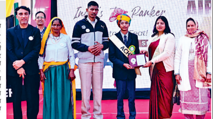
सफल विद्यार्थियों ने कहा कि यह सफलता आरपीएस परिवार की दूरदर्शी सोच और अटूट प्रश्रय का परिणाम है। विद्यालय द्वारा विद्यार्थियों को राष्ट्रीय स्तर की इन प्रतियोगी परीक्षाओं के लिए तैयार करने के लिए कई महत्वपूर्ण कदम उठाए गए। अनुभवी शिक्षकों और कानूनी विशेषज्ञों द्वारा नियमित कक्षाओं के साथ-साथ कठिन विषयों पर विशेष सत्र आयोजित किए गए।