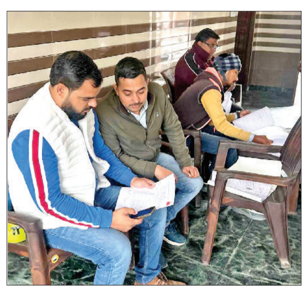
सोनीपत। गुड़ मंडी स्थित अग्रवाल धर्मशाला में शिविर के दौरान लोगों के दस्तावेजों की जांच करते नगर निगम कर्मचारी।

शहर में नगर निगम के अंतर्गत आने वाले विभिन्न वार्डों में पेयजल व सीवर कनेक्शन को वैध कराने की प्रक्रिया बुधवार को शुरू की गई। नगर निगम ने चार दिवसीय अभियान रूपी पहल के प्रथम दिन वार्ड नंबर 1 की सैनी धर्मशाला और वार्ड नंबर 14 व 15 में गुड़ मंडी स्थित अग्रवाल धर्मशाला में विशेष शिविर लगाया। शिविर में लोगों के पेयजल व सीवर कनेक्शन वैध करवाने के लिए दस्तावेज जमा किए गए। दोनों जगह शिविर के माध्यम से कुल 71 लोगों ने अपने दस्तावेज जमा करवाए, जबकि 9 लोगों के दस्तावेज अधूरे पाए जाने पर उन्हें दोबारा पूरे दस्तावेजों के साथ शिविर में पहुंचने का मौका दिया गया। निगम के विभिन्न वार्डों में अवैध कनेक्शनों का आकड़ा वैध कनेक्शनों पर भारी पड़ रहा है।