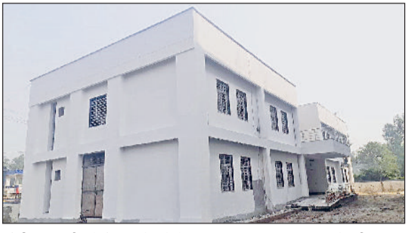
सोनीपत। बड़ी औद्योगिक क्षेत्र में तैयार किया गया ईएसआई डिस्पेंसरी का नया भवन।

बड़ी औद्योगिक क्षेत्र में करीब 11 साल बाद यहां कार्यरत कामगारों को ईएसआई डिस्पेंसरी की सौगात मिलेगी। केंद्रीय लोक निर्माण विभाग (सीपीडब्ल्यूडी) ने यहां 1500 मीटर जमीन पर 3 करोड़ रुपये की लागत से दो मंजिला ईएसआई डिस्पेंसरी भवन का निर्माण किया है। भवन में फिलहाल बिजली संबंधी कुछ कार्य शेष बचे हैं, इन्हें पूरा करवाने के लिए मुख्यालय से बजट की मांग की गई है। विभाग ने फरवरी माह तक शेष कार्यों को पूरा करवाने का लक्ष्य रखा है। फिलहाल बड़ी औद्योगिक क्षेत्र में किराये के 5 कमरों के अस्थाई भवन में ईएसआई डिस्पेंसरी चल रही है। हरियाणा राज्य औद्योगिक और बुनियादी ढांचा विकास निगम (एचएसआईआईडीसी) ने बड़ी औद्योगिक क्षेत्र में ईएसआई डिस्पेंसरी के निर्माण के लिए वर्ष 2014 में केंद्रीय लोक निर्माण विभाग को जमीन आवंटित की थी।