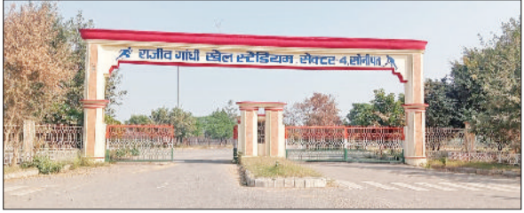
सोनीपत। सोनीपत के सेक्टर-4 स्थित राजीव गांधी खेल स्टेडियम।

पीएमश्री राजकीय विद्यालयों के विद्यार्थी स्पोर्ट्स डे मनाकर खेलों के माध्यम से अपनी प्रतिभा को प्रदर्शित करेंगे। शिक्षा विभाग का उद्देश्य राजकीय विद्यालयों के विद्यार्थियों को पढ़ाई के साथ खेलों के प्रति प्रोत्साहित करना है। इसी के तहत विभाग पीएमश्री राजकीय विद्यालयों के विद्यार्थियों के लिए