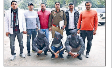
तीन आरोपी पकड़े